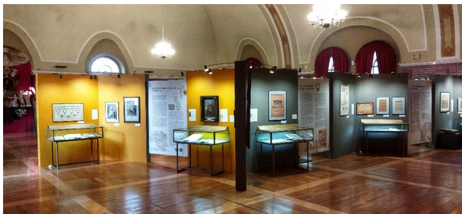
Tak wygląda sala wystawowa.

„Na styku światów. Dzieje Leszna od XVI do XX wieku” znajduje się w dużej sali synagogi. Tu zobaczysz i poznasz historię Leszna od początku jego istnienia do wczesnych lat powojennych, kiedy powstało Muzeum.